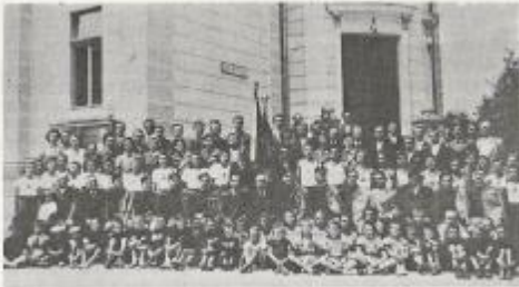
Zaradi navzočnosti društev so se tradicionalne skupnosti hitreje spreminjale ali pa so postale njihov sestavni del. (Domžalski Sokol pred društvenim domom pred 2. svetovno vojno)