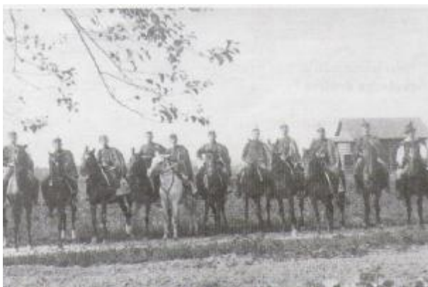
Domžalski Sokoli okoli leta 1935