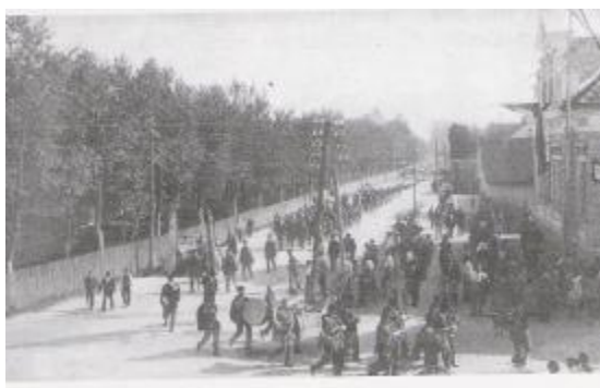
Sokolski zlet v Domžalah, 19. avgusta 1928 na desni je Sokolski dom