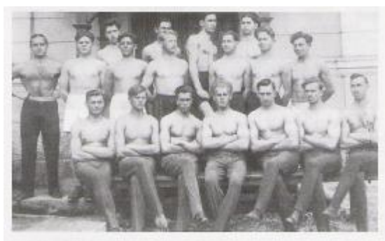
Člani Sokolskega društva Domžale 1932