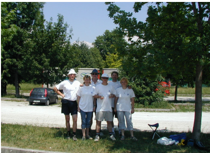
Ekipa TVD Partizan v sezoni 2003