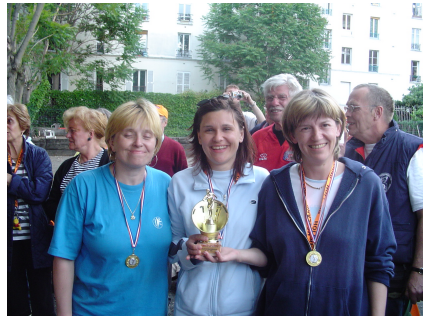
Ženska ekipa na turnirju v Parizu leta 2004

V klubu začnemo razmišljati tudi o organizaciji večjih tekmovanj, predvsem državnih prvenstev in mednarodnih tekmovanj. Prvič smo prireditelji DP v zbijanju leta 2001, kasneje pa priredimo še vrsto državnih prvenstev predvsem za ženske in mladino. V letu 2003 priredimo prvi mednarodni turnir s preko 100 udeleženci iz Avstrije, Madžarske, Češke in Slovenije. Vrhunec našega organizacijskega prizadevanja pa je jubilejno leto 2005, ko se okoli 200 udeležencev iz 10 držav udeleži prav v Domžalah novoustanovljenega tekmovanja za države srednje Evrope, imenovane Centrope Cup, turnir pa obenem sovпада tudi s praznovanjem občinskega praznika. Prav v posebno čast smo imeli pozdraviti na tekmovanju predsednika svetovne zveze Clauda Azema.