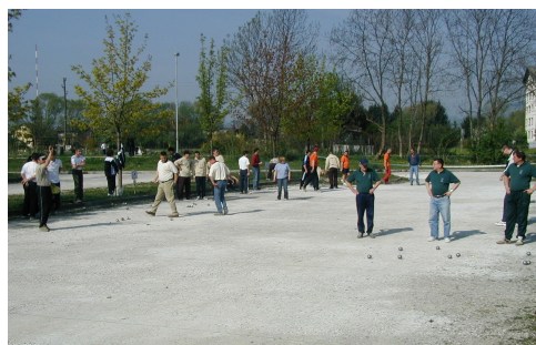
Mednarodni turnir v Domžalah 2003