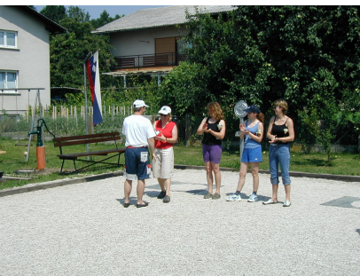
Organizacija DP v zbijanju leta 2002