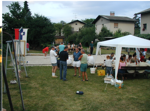
Gradnja igrišča za tekmovalno petanko 2001 Na otvoritvi igrišč je bilo zelo živahno